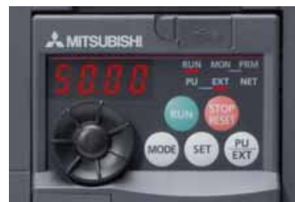
Встроенная панель управления с поворотным пультом управления

Благодаря встроенному поворотному пульту управления пользователь получает более быстрый непосредственный доступ ко всем важнейшим параметрам — по сравнению с традиционными кнопочными системами управления.